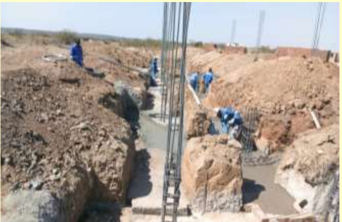
Die Fundamente werden ohne schweres Gerät von Hand mit Spaten und Pickel gegraben – Juli 2018