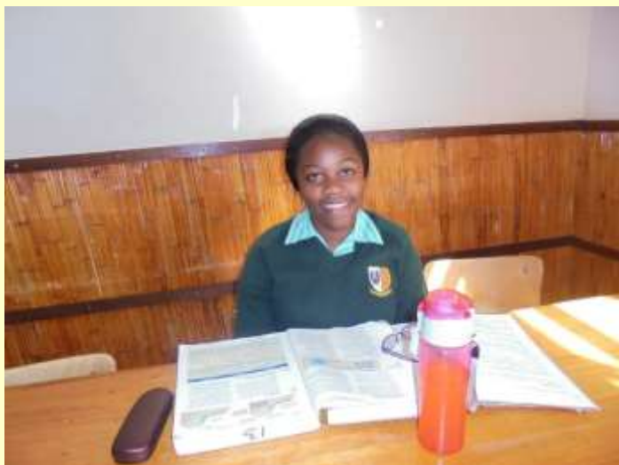
Studentin während der Studierzeit

Das Hostel besteht nun rund 50 Jahre, das heißt aber auch, dass das Haus in die Jahre gekommen ist und Renovationen anstehen. Erfreulicherweise war es durch besondere Spenden bereits möglich, das schadhafte Dach und die Erneuerung der Toilettenanlagen zu unterstützen.