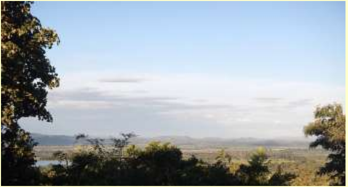
Blick ins Tal von Chishawasha