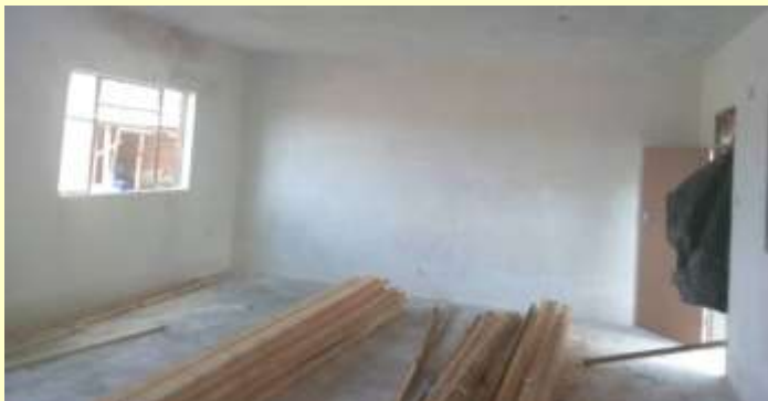
Blick in einen Klassenraum – Februar 2019