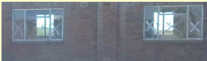
Die verglasten Fenster des Neubaus – April 2019