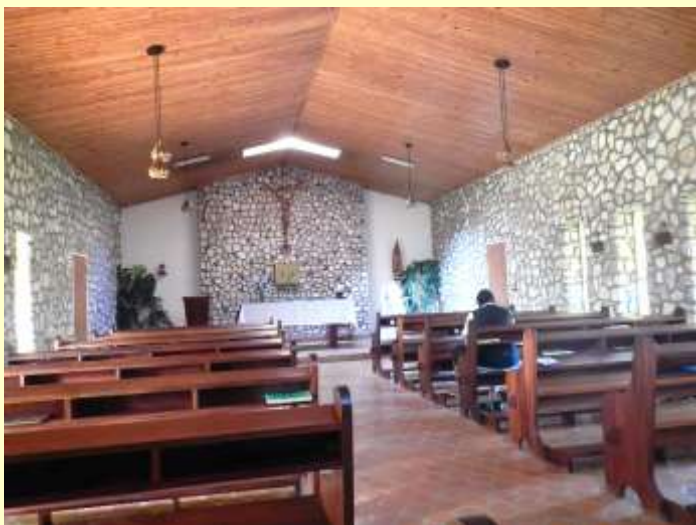
Kapelle der Schwestern