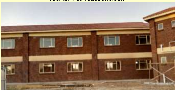
links: Teil Klassenblock Rechts: Sanitärbereich, WC Lehrer