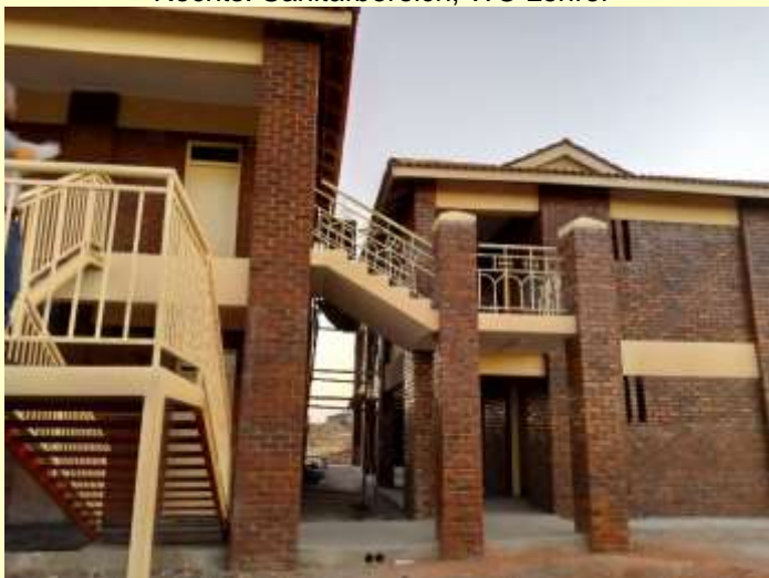
Verbindung zwischen den Häusern Juni 2019