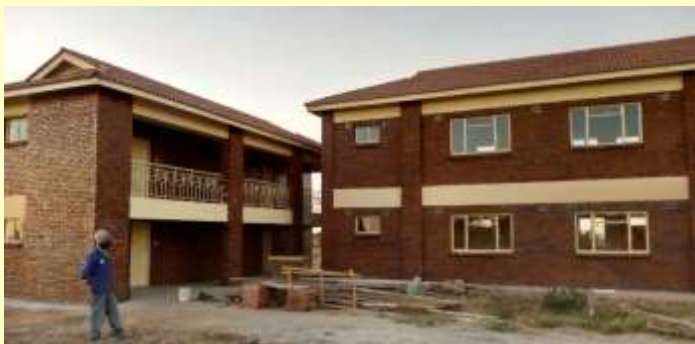
links: Sanitärbereich Schülerinnen/Schüler rechts: Teil Klassenblock